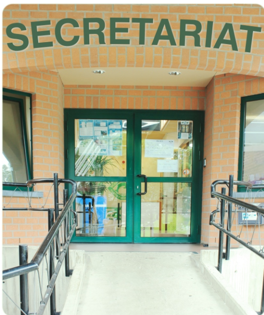
A l'entrée de la piscine olympique

Lundi 16h00 - 20h15 Mardi 09h00 - 20h15 Mercredi 12h00 - 20h15 Jeudi 09h30 - 13h00 16h00 - 20h15 Vendredi 09h00 - 20h15 Samedi 09h00 - 12h45